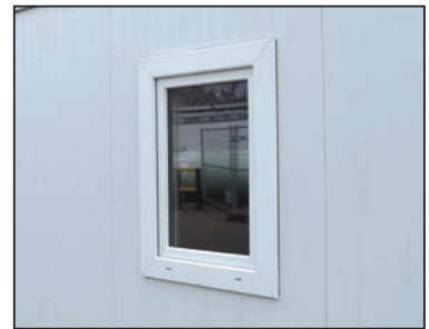
Bild 40c90296.jpg – Isoliertes Fenster, auf Wunsch auch mit Gitter und Sicherungsplatte gegen Vandalismus und Diebstahl.