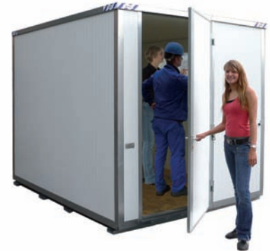
Bild 40c90323.jpg – Isolierter RaumContainer mit vielen Einsatzmöglichkeiten