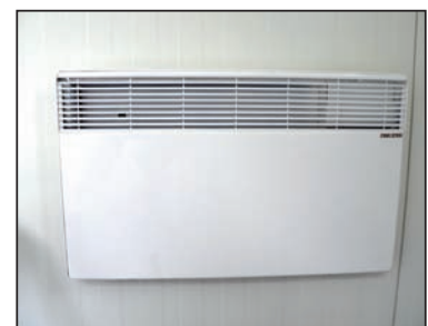
Bild 40c90271.jpg und 40c90276.jpg – Optional Klimaanlage und Heizung ab Werk lieferbar.