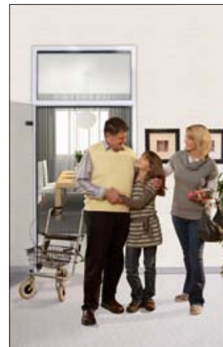
Schöner Komfort im Alltag